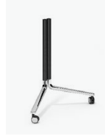
6990/63 - Temo Fliptop Y / 160 x 80 cm