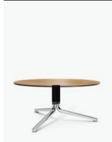
6935/03 - Temo III H 45 cm Ø 80 cm