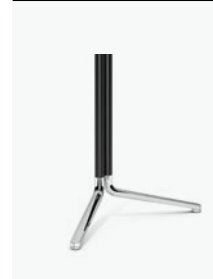
6920/63 - Temo Y Foot 160 x 80 cm