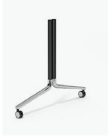
6980/63 - Temo Fliptop T / 160 x 80 cm