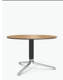
6930/03 - Temo III H74cm Ø 80cm