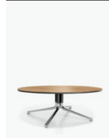
6945/03 - Temo IV H 45 cm Ø 80 cm