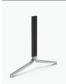
6910/63 - Temo T Foot 160 x 80 cm