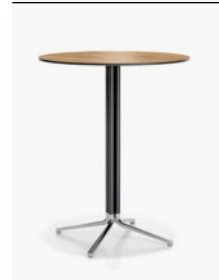
6941/03 - Temo IV H 110 cm Ø 80 cm (fliptop)